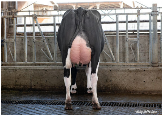
WESTCOAST FSTBL FAR8167 10707 DAM