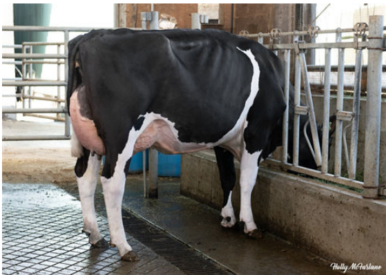
WESTCOAST FSTBL FAR8167 10707 DAM